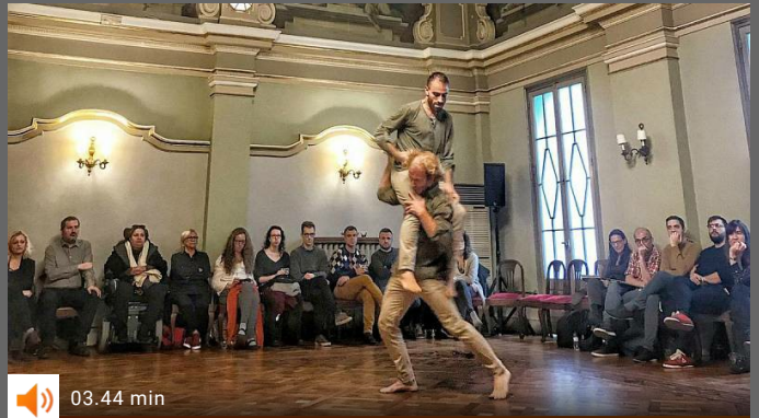
Violencia y robots, vanguardia inquietante en Girona