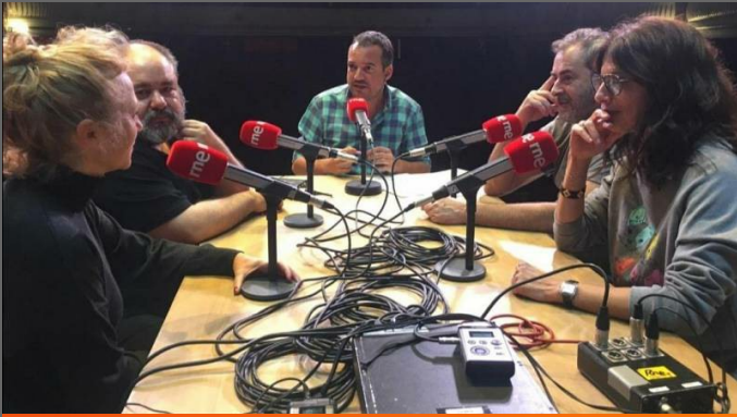
Sobre el escenario con Jorge Bosch, Jorge Calvo, Maribel Verdú y Pilar Castro